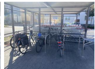
Penny Lange Straße

In der Gesamtsicht schneiden die Standorte von Aldi und Lidl am besten ab, Edeka, Kaufland und Netto bilden das Mittelfeld, die Filialen von Penny und REWE befinden sich am Ende der Skala.