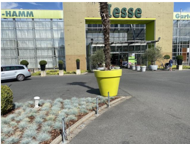
Gartencenter Hesse Kampshege 2