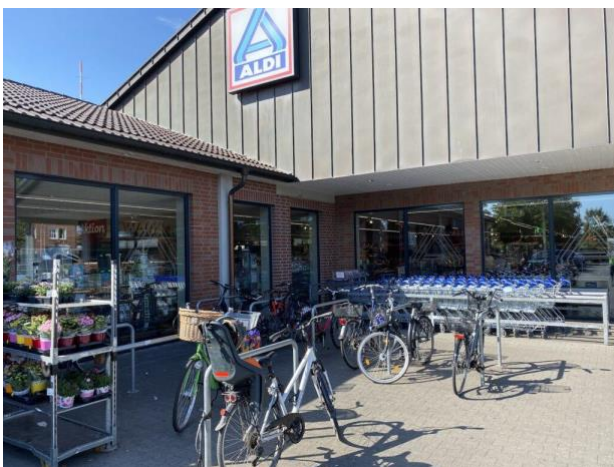
Aldi - Grünstraße 102