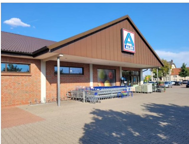
Aldi - Kamener Str. 148 Pelkum