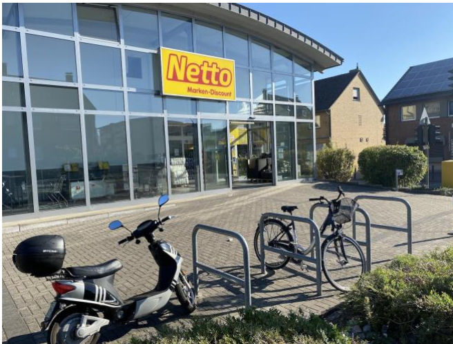
Netto - Ehrenfeldstr. 1 Bockum-Hövel