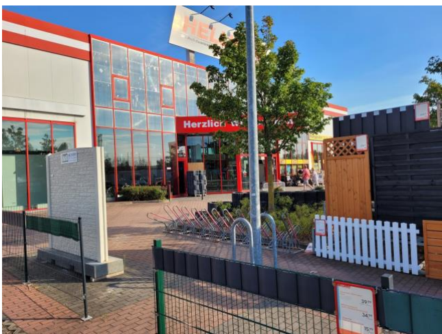
Baumarkt Hellweg Östingstraße 3