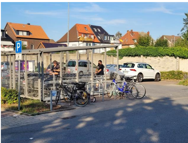
Netto - Caldenhofer Weg 138 a