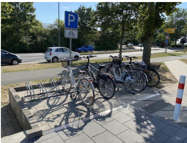
Netto - Heessener Str. 79 Heessen