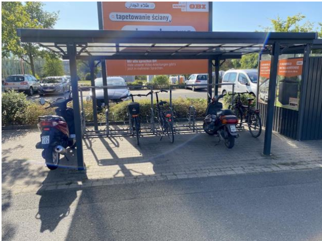
Bau- und Gartencenter Obi Sachsenweg 22