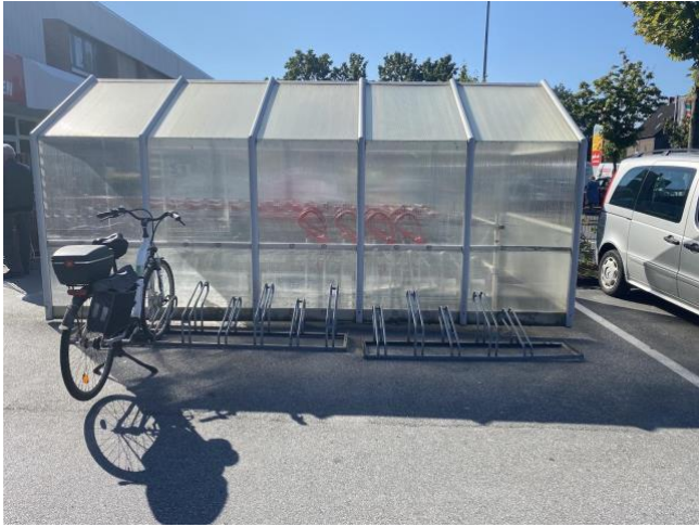
toom Baumarkt Dortmunder Str. 110