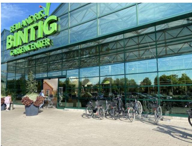
Gartencenter Bintig Sachsenring 11