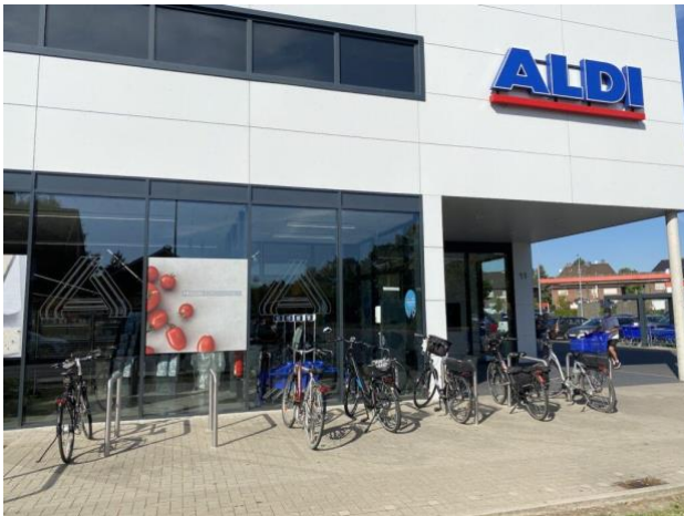
Aldi - Kleine Amtsstraße 11 Heessen