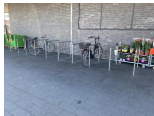
Aldi - Lippe-Einkauf-Zentrum